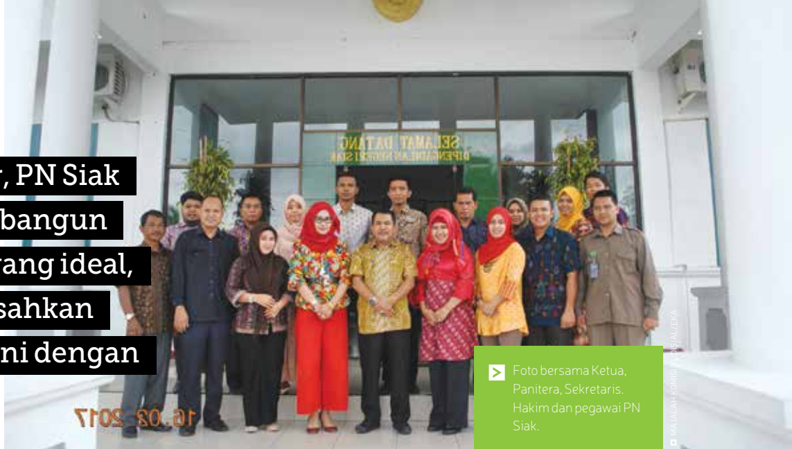
► Foto bersama Ketua, Panitera, Sekretaris, Hakim dan pegawai PN Siak.