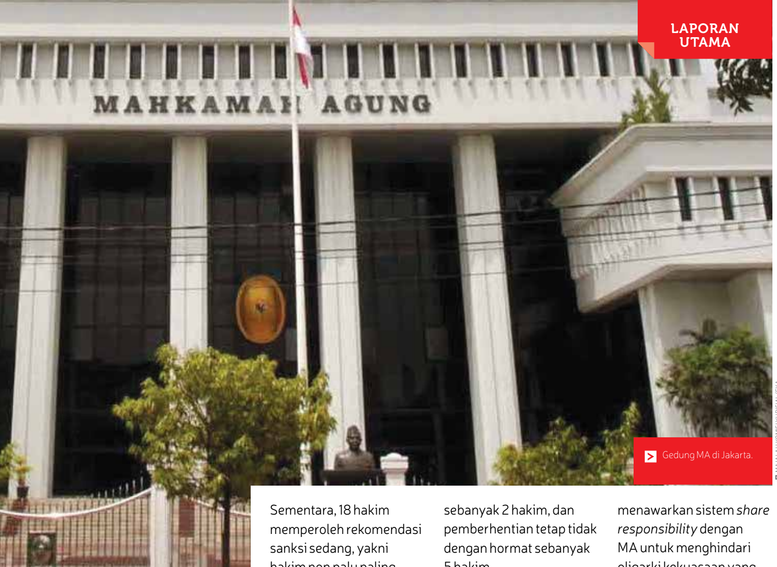
▶ Gedung MA di Jakarta.