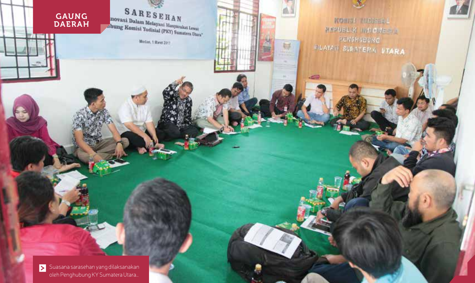
► Suasana sarasehan yang dilaksanakan oleh Penghubung KY Sumatera Utara..