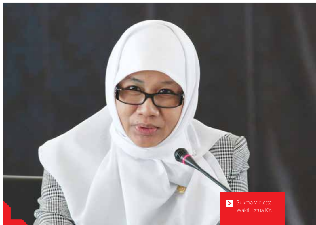
MAJALAH KOMISI YUDISIAL/EKA

“Kalau ini mau diambil lagi oleh KY, bagaimana