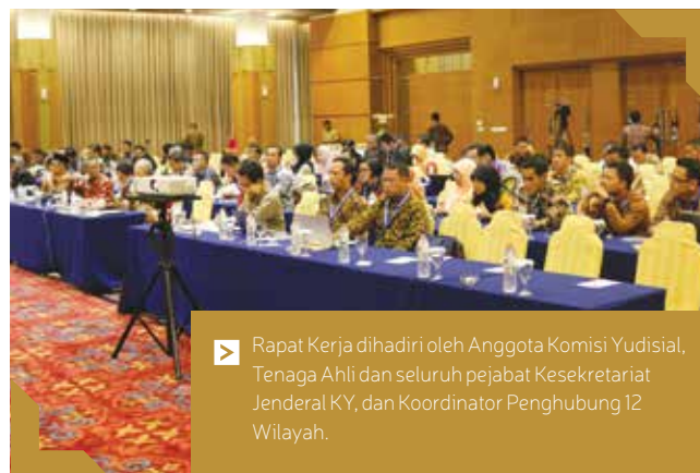
▶ Rapat Kerja dihadiri oleh Anggota Komisi Yudisial, Tenaga Ahli dan seluruh pejabat Kesekretariat Jenderal KY, dan Koordinator Penghubung 12 Wilayah.

“KY merupakan lembaga negara yang memiliki tugas khusus bidang etik yaitu sebagai penjaga dan penegak etik hakim, untuk itu perlu adanya penguatan SDM yang berkompeten di bidang etik”