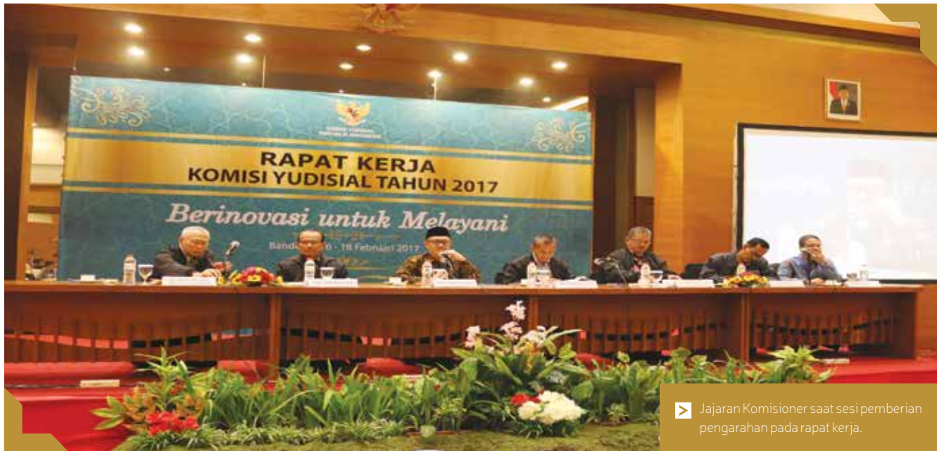
▶ Jajaran Komisioner saat sesi pemberian pengarahan pada rapat kerja.