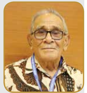
AJ Day Tenaga Ahli KY

Masalah terorisme kembali menjadi heboh dengan peristiwa pengeboman di Jalan Thamrin, Jakarta Pusat. Timbul lah wacana untuk melakukan amandemen terhadap Undang-Undang tentang Tindak Pidana Terrorisme, yaitu tentang UU No. 15 Tahun 2003 untuk lebih mengefektifkan pemberantasan tindak pidana terorisme.