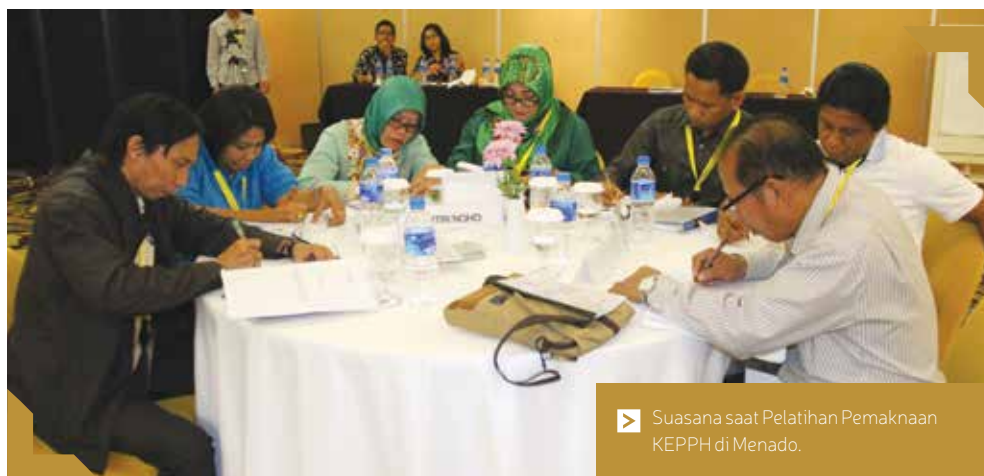
▶ Suasana saat Pelatihan Pemaknaan KEPPH di Manado.

Materi lain yang tak kalah penting adalah pengembangan profesional hakim dimana pada materi ini peserta dapat mengambil manfaat pengalaman yang ditularkan oleh